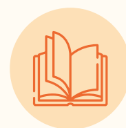
Tabla de contenido para la introducción